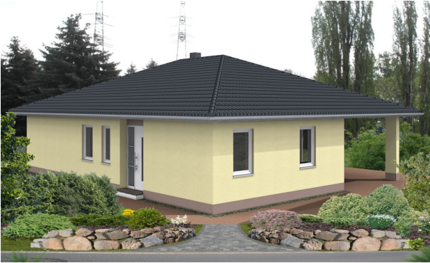
Bungalow 3D Ansicht